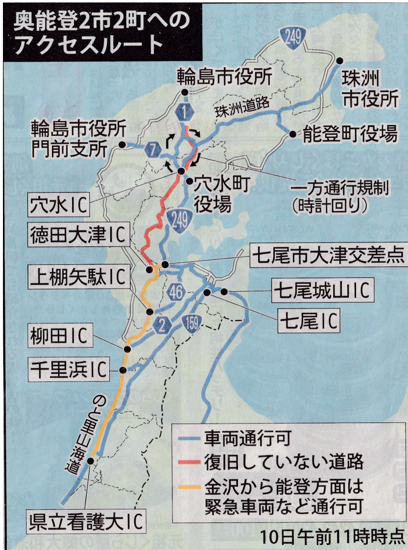
左の図: 令和6年1月10日 (震災から10日後)