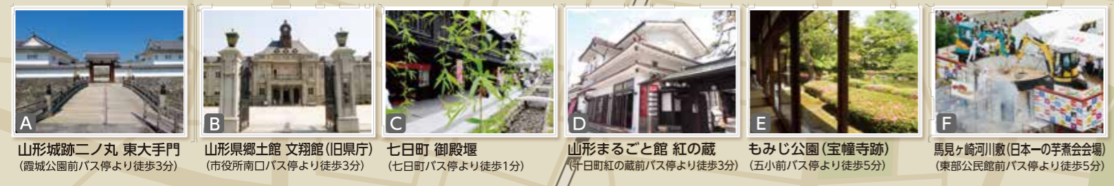
A 山形城跡二ノ丸 東大手門 (霞城公園前バス停より徒歩3分) B 山形県郷土館 文翔館(旧県庁) (市役所南口バス停より徒歩3分) C 七日町 御殿塚 (七日町バス停より徒歩1分) D 山形まるごと館 紅の蔵 (十日町紅の蔵前バス停より徒歩3分) E もみじ公園(宝幢寺跡) (五小前バス停より徒歩5分) F 馬見ヶ崎川(日本の芋煮会会場) (東部公民館前バス停より徒歩5分)